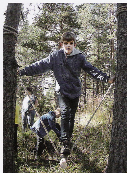
Terrengløype med 6. Drammen MS.