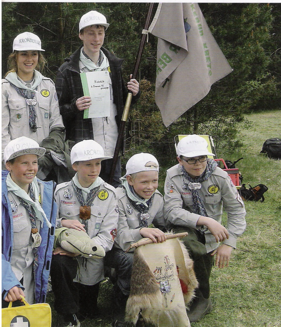
p om. I år var det Krokodillepatruljen som erobret kretsbanneret og deltok på NM i speiding.